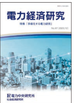
電力経済研究 No.67 (2020年12月) [多様化する電力経営] https://criepi.denken.or.jp/jp/serc/periodicals/index.html